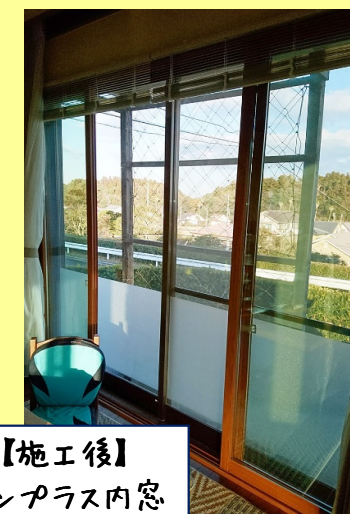
【施工後】インプラス内窓

デメリットは、外側と内側の窓をそれぞれ掃除する手間です(ただ、内側の窓はそんなに汚れないです)。また、換気のために2回窓を開けなければならないので、面倒に感じる方も。メリットもデメリットもしっかり説明しますので、当店にご相談ください!